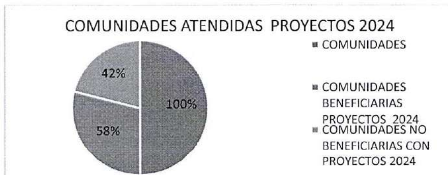
Grafico N°. 4 Comunidades con proyectos 2024